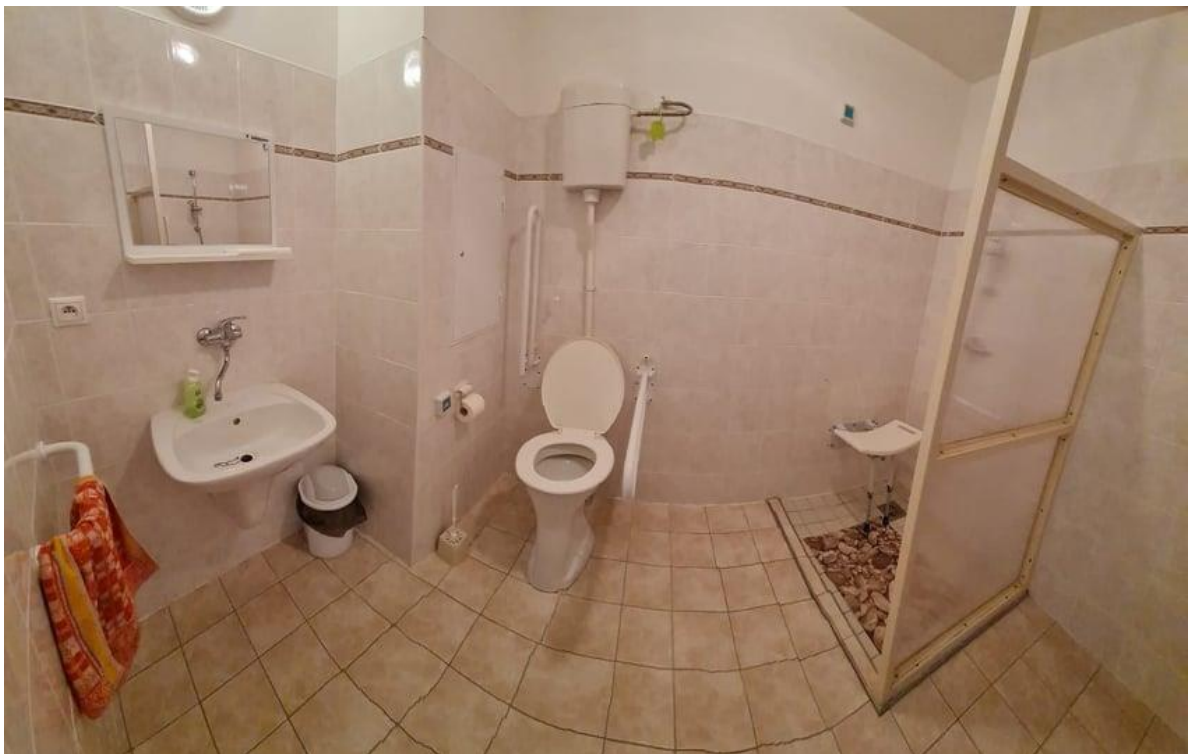
Sociální zařízení na pokoji uživatelů