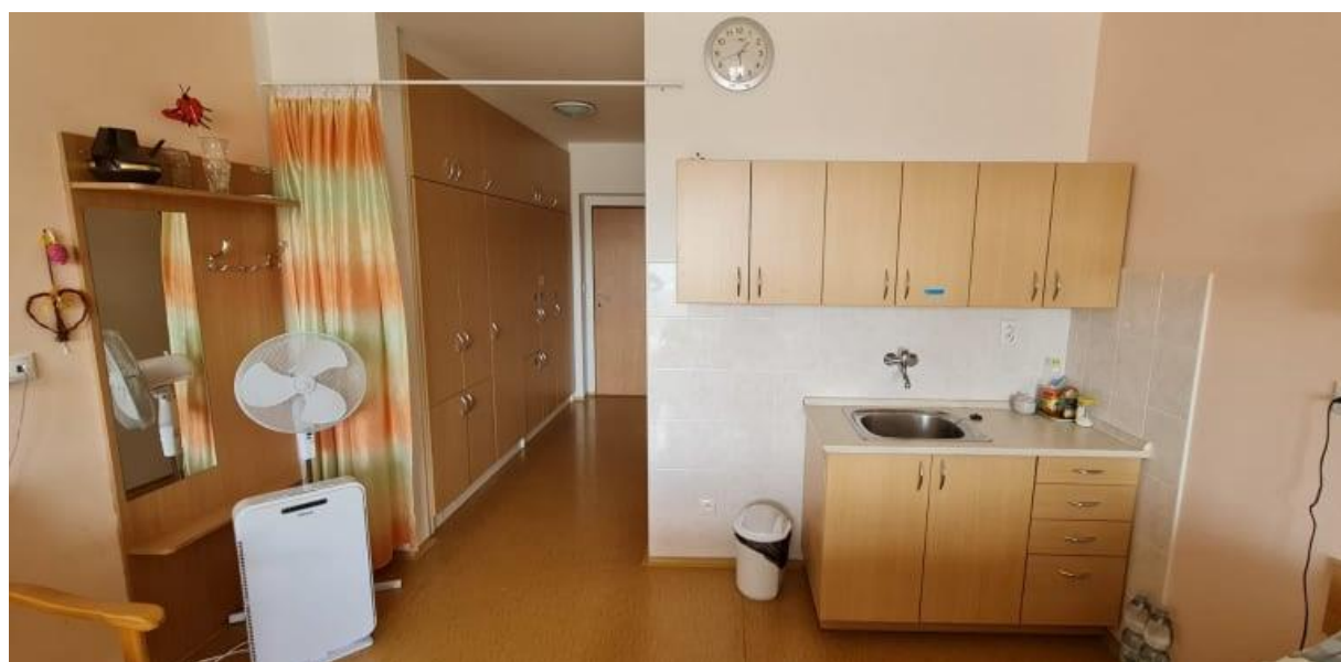
Kuchyňský kout na pokoji