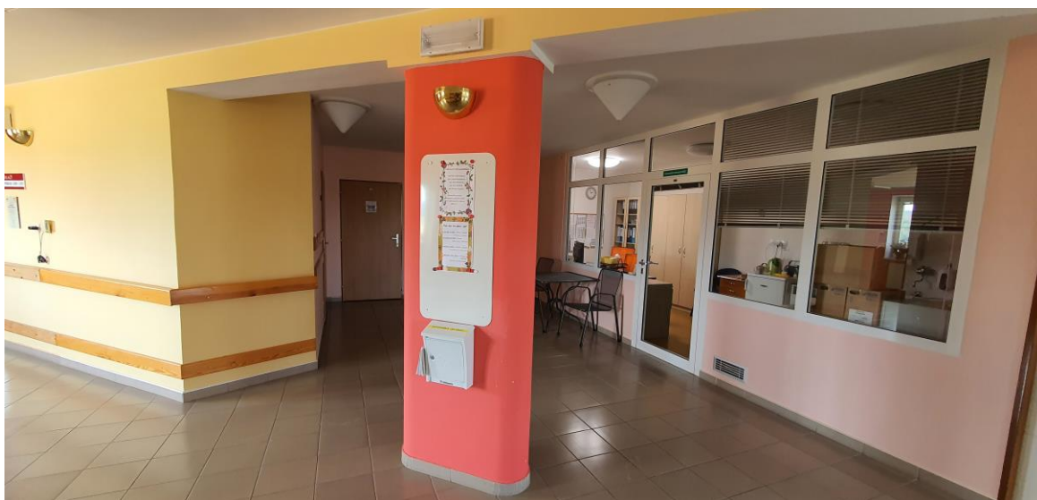
Chodba, pracoviště sociální péče ve 2. podlaží