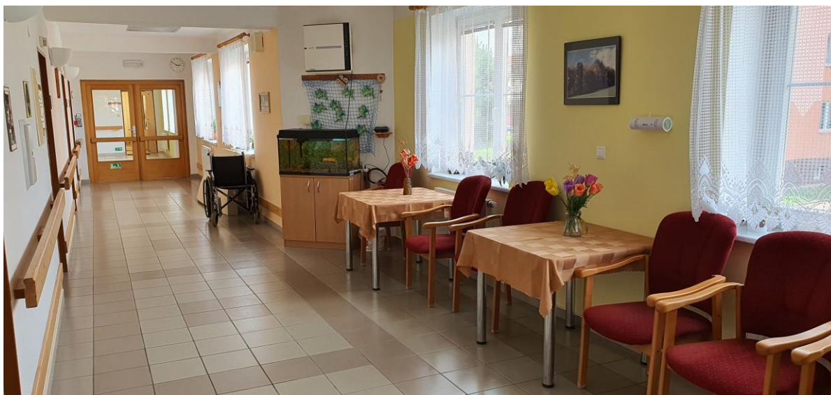
Chodba s pokoji