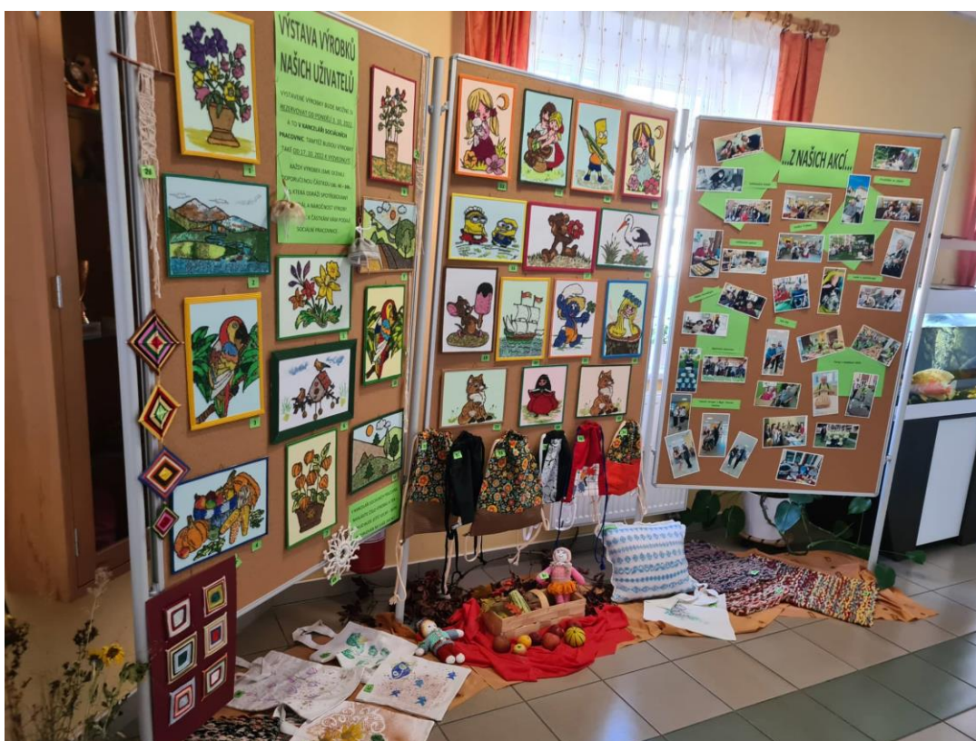
Tvoření v dílničce