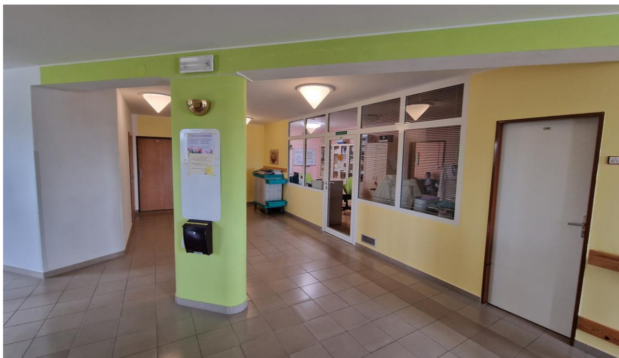
Chodba ve 4. podlaží, pracoviště sociální péče