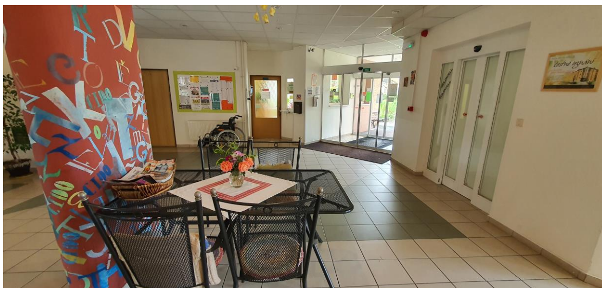
Vchod a recepce