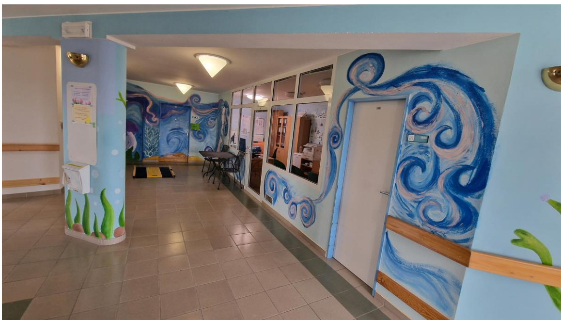
Chodba ve 3. podlaží, kancelář vedoucího sociální péče a vedoucí zdravotní péče, pracoviště sociální péče