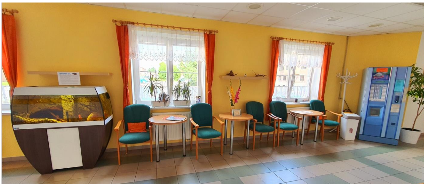
Kavárnička v přízemí