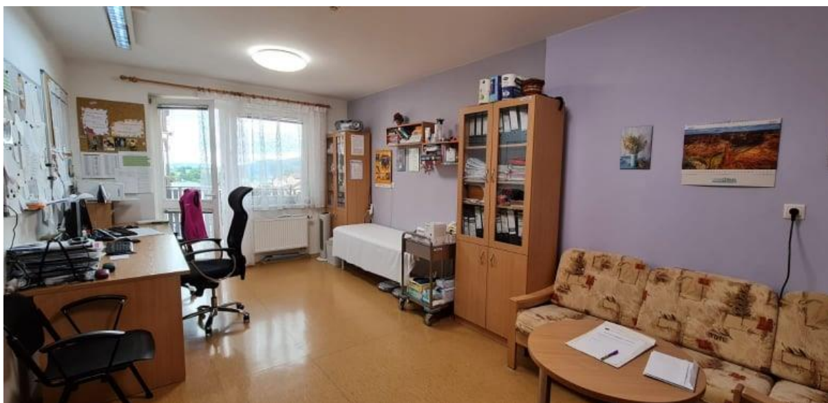
Ordinace lékaře ve 3. podlaží